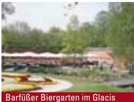
Barfüßer Biergarten im Glacis