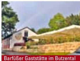
Barfüßer Gaststätte im Butzental