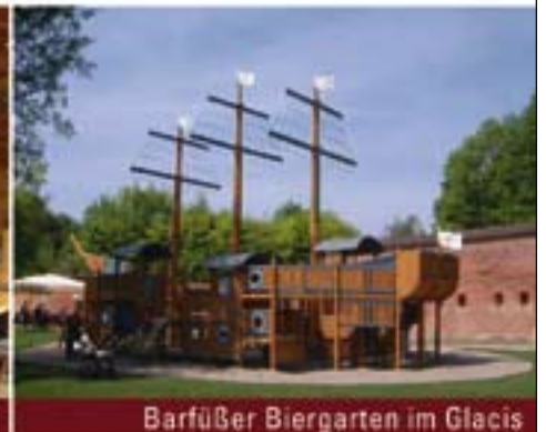
Barfüßer Biergarten im Glacis