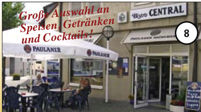
Bistro Central Marktplatz 2 · 89547 Gerstetten · Tel. 07323 4992 täglich von 10 - 2 Uhr nachts · Sonn- und Feiertage 14 - 3 Uhr nachts

Die am Rande werbenden Gaststätten unterstützen diese Aktion und freuen sich über einen Besuch!