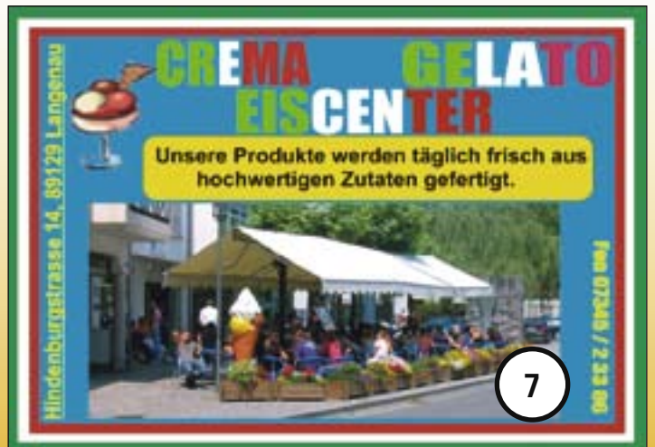
CREMA GELATO EISCENTER Unsere Produkte werden täglich frisch aus hochwertigen Zutaten gefertigt. Hindenburgstrasse 14, 89129 Langenau Fon 07348 / 2 33 90