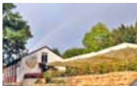
Barfüßer Gaststätte im Butzental