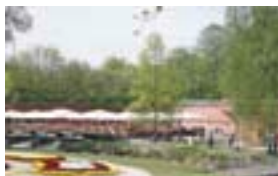
Barfüßer Biergarten im Glacis