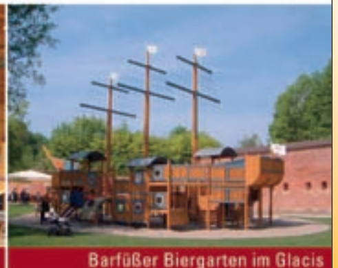
Barfüßer Biergarten im Glacis