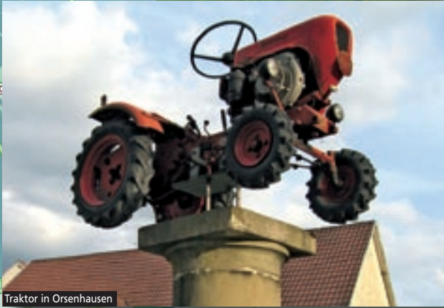
Traktor in Orsenhausen