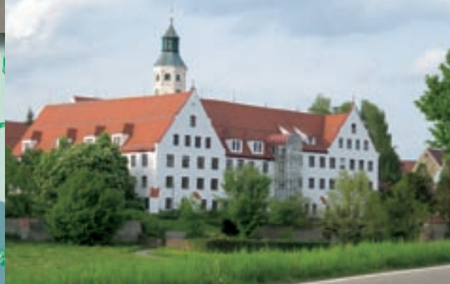
Heggbach bei Maselheim