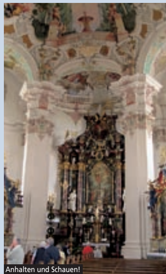
Anhalten und Schauen!

Dieser Tourvorschlag führt uns durch die barocke, oberschwäbische Landschaft - das Storchengai! Auf herrlichen, kurvenreichen Straßen fahren wir zuerst über das Hochsträß, wo wir bei Eggingen einen Ausblick ins Oberschwäbische genießen können, weiter an die Donau bei Öpfingen. Von da an haben wir immer die Silhouette des Berges Bussen vor uns.