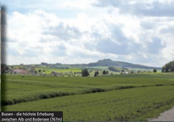
Bussen - die höchste Erhebung zwischen Alb und Bodensee (767m)